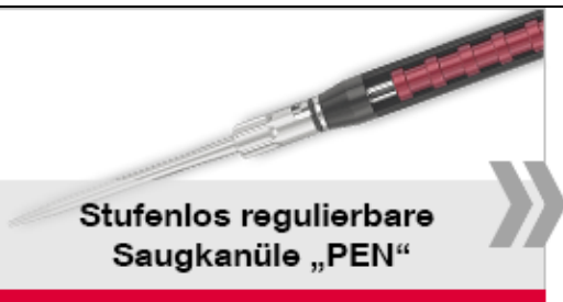
Stufenlos regulierbare Saugkanüle „PEN“